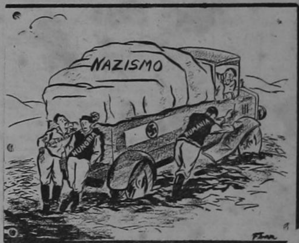
FALTA DE ANIMO

seis u ocho por uno, el esfuerzo de producción bélica del Japón debe ser asunto grave. Aún ahora, en que su debilidad es notoria, el Japón no ha recibido todavía el impacto completo de nuestro poderío aéreo. Pero, muy pronto entre los resplandores de la terrible hoguera que provocó el Japón, lo veremos caer para siempre.