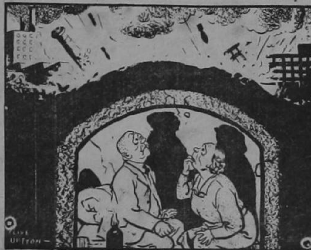
DIFERENCIA DE OPINIONES...