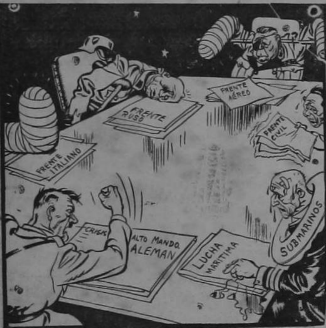
SEÑORES, UN POCO DE FORMALIDAD!

que salía "más cara de hierro".) (Nos parece raro que preocupándole el ejército no quisiera tocar la diana.)