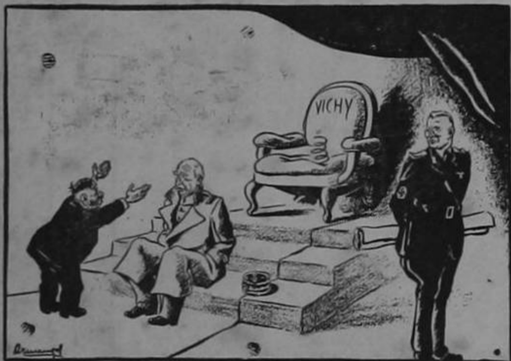
LA SILLA RESULTA INCOMODA