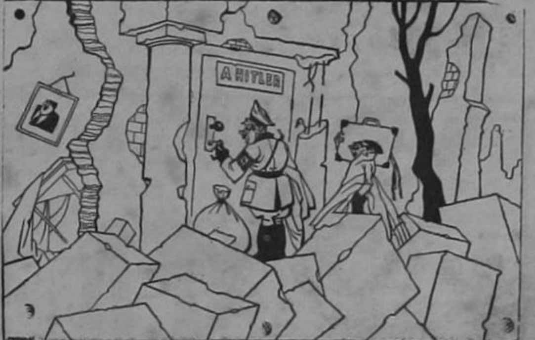
EL REGRESO AL HOGAR...

El libro es sumamente interesante y de un enorme valor histórico. A nuestro juicio debía estar al alcance de todos los hogares costarricenses. Es más, nos permitimos sugerir la conveniencia de que fuera reeditado. Para la mano amiga que de la Embajada nos envió ese valiosísimo libro, muchas gracias por nuestro gobierno a fin de distribuirlo entre todos los colegios del país.