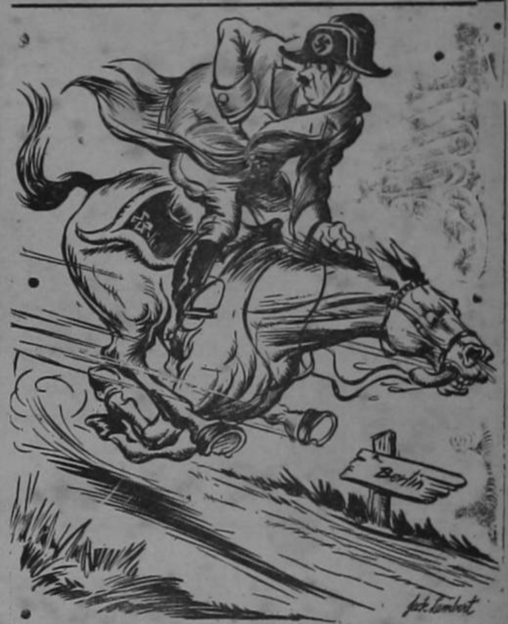
RETIRADA DE RUSIA — MODELO 1944