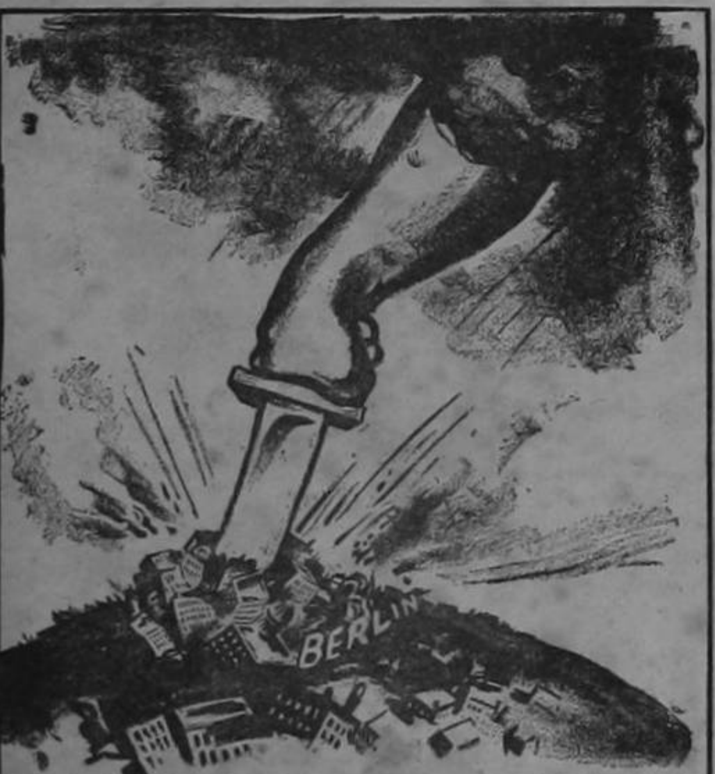
"Ninguna ciudad alemana será jamás bombardeada".

—Pues entonces, ¿por qué te casas con ese hombre?