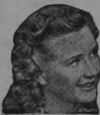
Priscilla Lane de la Warner Bros

LA cara, los brazos y las manos adquieren un aspecto fresco y encantador aplicando Crema Primavera antes de empolvase. Véalo en su espejo. El cutis marchito y macilento se esfuma y aparece la piel rosada y transparente que es tan atractiva y tan admirada.